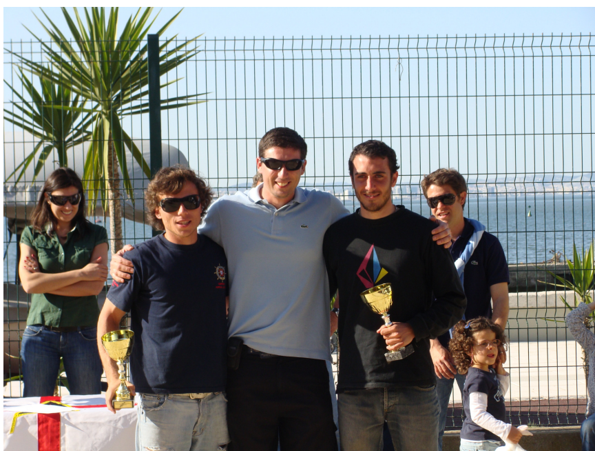
A dupla do CVB Vice Campeã

A próxima e última Prova de Apuramento Nacional decorrerá no Sharpie Clube de Ílhavo nos dias 15 e 16 de Maio. Até treinem bastante!!!!